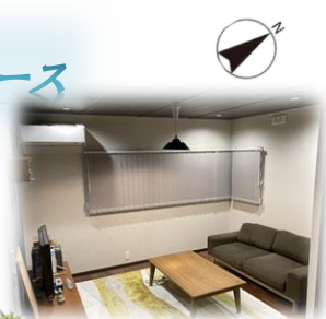
2024年2月 現地内覧撮影 リビング