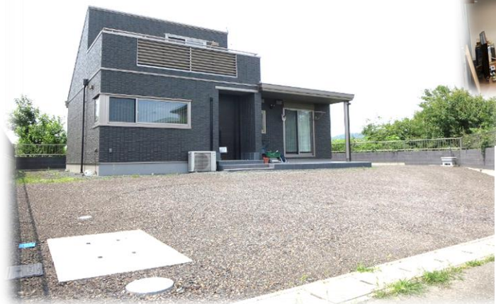
2022年6月 敷地内南東方面より現地外観撮影 ※街並み含む